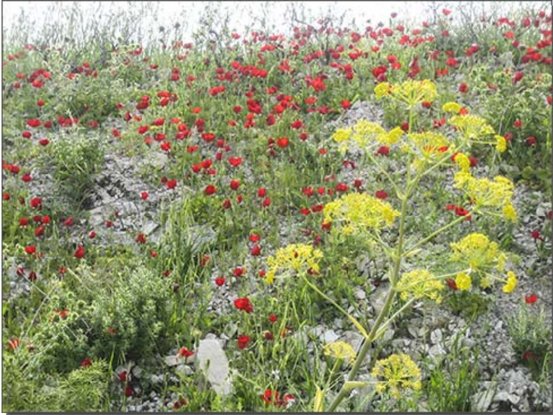
Den vilda vallmon blommar.

Göran Larssons jubileumsfond för judisk-kristna relationer: Adress i Israel: Hatekufa 17/4, 92628 Jerusalem tel. 00972-2 648 1979 eller 00972-50 685 0346 (mobil) E-postadress: goran.larsson@judiskkristnarelationer.se Hemsida: www.judiskkristnarelationer.se PlusGiro (Postgiro) 195 85 45-4 Bankgiro 5374-4249