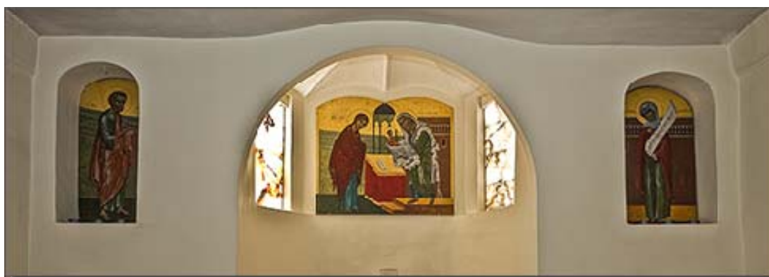
Altarmålningarna i kapellet på Svenska Teologiska Institutet.