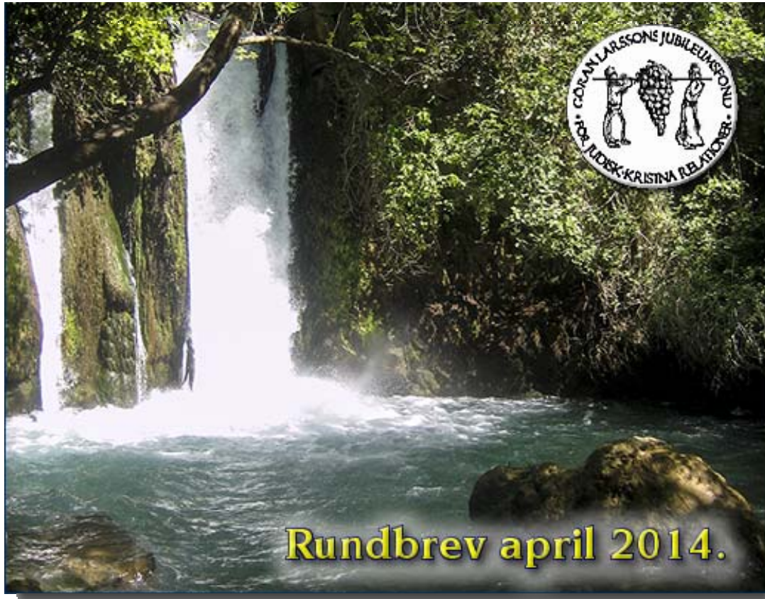
Jordanflodens livgivande källflöden vid Hermonbergets södra sluttningar.