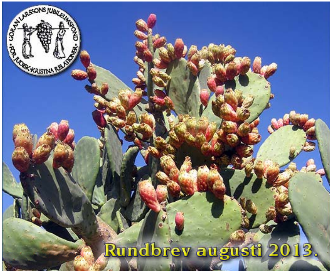
Sabrakaktusens frukt har ett tjockt taggigt skal men ett sött och smakligt inre. Sabra används ibland som namn på de infödda israelerna...