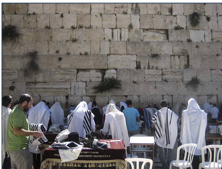
Gudstjänst vid Västra muren.

och vi är givetvis tacksamma för det lugn vi trots allt får åtnjuta i denna oroliga del av världen. När den norske utrikesministern var på besök för några dagar sedan gjorde han ett uttalande som nog ganska väl sammanfattar tillståndet här: "När vi betraktar en karta över Mellanöstern, finns det två små landområden som är lugnare än resten – Israel och Västbanken ... Israelerna och palestinierna har en sak gemensam: de är på samma sida när det gäller synen på Iran, Syrien och Muslimska brödrskapet. Både Ramallah och Jerusalem vill begränsa dessa aktörers inflytande." Han framhöll också som positivt att Muslimska brödrskapets fall i Egypten bidragit till att stärka den