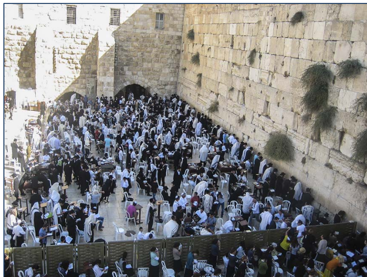
Västra muren är judenhetens heligaste – och största – "synagoga". Under sabbaten och högtiderna fylls den ofta till bristningsgränsen.

Dessutom är det en sak som förenar krishärdarna runtom, och det är hatet mot Israel. Oavsett vilka som har eller tar makten, kan man vara förvissad om att Israel kommer att utgöra minsta gemensamma nämnaren för deras hot och hat. När jag skriver detta, klargör Syriens vice utrikesminister på