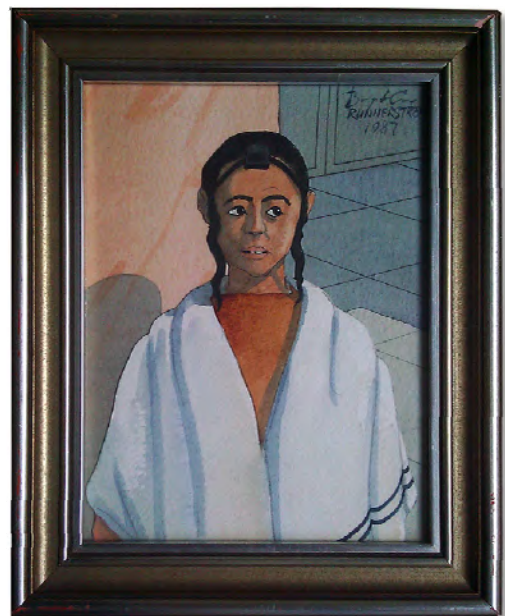
Jesus som Bar mitzva-pojke enligt illustratören Bengt Arne Runnerström.