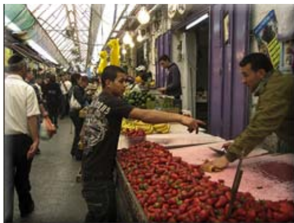
Jordgubbar i december.

Visserligen finner man berg av allehanda citrusfrukter i marknadsständerna nu också, och för några dagar sedan såg jag de första färska jordgubbarna. Men hösten har övergått i vinter även här. Redan före fem på eftermiddagen är det mörkt, nätterna är kalla och vinterregnen har tvättat bort dammet från ett halvårs torka och börjat fylla Gennesarets sjö och landets vattenreservoarer.