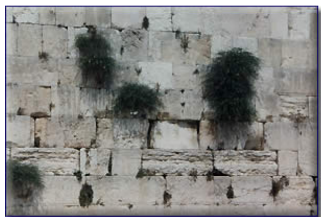
Närbild av Västra Muren.

Här har vi njutit av en underbar högsommar med temperaturer kring 30 grader och ljuvligt ljumma kvällar. I går svängde dock vädret och vi har fått höstens första regn, det första sedan i maj. Låt oss hoppas att detta regn förebådar en lång och rik regnperiod. Här utgör torka och vattenbrist ett konstant hot. Den politiska temperaturen har som ni nog kan förstå varit särskilt hög de senaste dagarna.