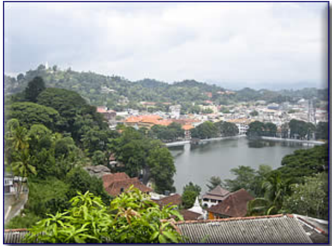
Utsikt över Kandy.