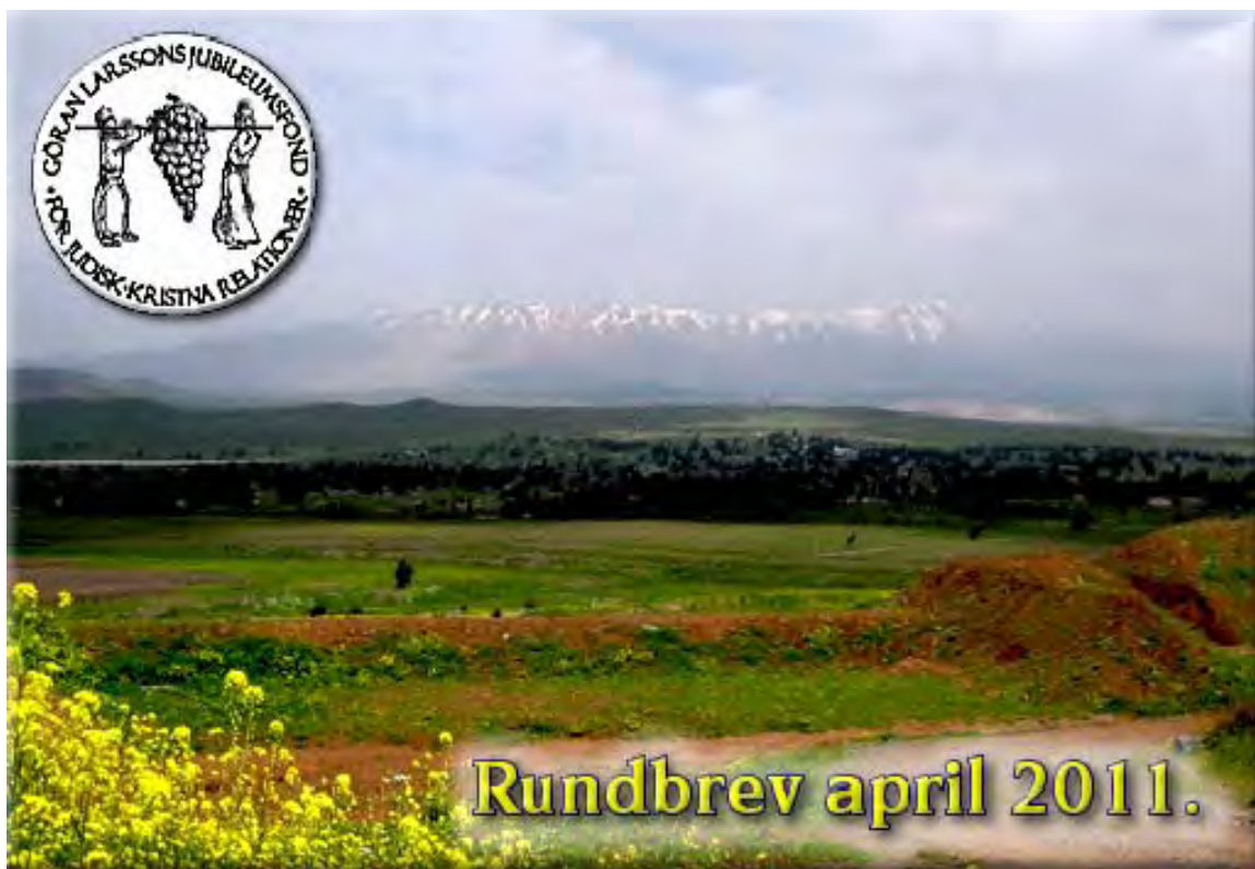
Berget Hermon i bakgrunden - med topparna fortfarande snötäckta.