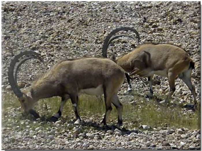
Ett rikt och känsligt naturliv kännetecknar Dödahavsregionen. Här kan man se betande stenbockar...

Konsekvenserna är många. Redan nu undermineras de allt bredare stränderna av stora hålrum när vattnet drar sig tillbaka. Stora varningsskyltar förkunnar att det är livsfarligt att vandra i området mellan vägen och havet, och man befärar att det snart även kan bli farligt att färdas på vägen. Man har därför i många år talat om nödvändigheten av att leda vatten till Döda havet. Två planer har diskuterats.