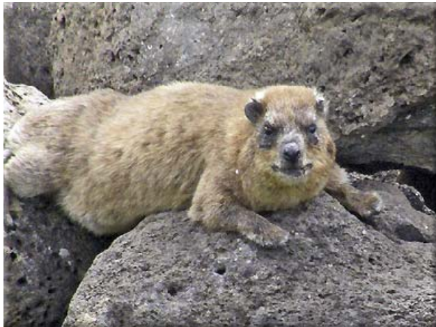
... och klippdassar, som njuter av tillvaron...

Antingen skulle man göra en tunnel från Medelhavet ned till Döda havet, som