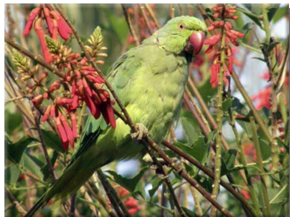
och man kanske rentav blir tilltalad av en papegoja!

Projektet presenterades igår vid "Presidentens konferens" i närvaro av ett stort antal tidigare och nuvarande stats- och regeringschefer, ministrar, parlamentariker, diplomater, forskare och kulturpersonligheter. Förutom Israels president Simon Peres har Jordaniens kung Abdullah uttryckt