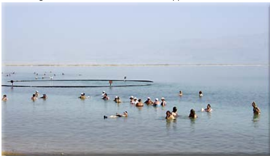
Döda havet är en attraktion för människor från hela världen som vill njuta av den sällsamma upplevelsen att flyta utan minsta ansträngning.

Sådana har ofta en tendens att fokusera på det som skiljer, medan det här handlar om något som ligger i allas intresse, nämligen att skapa förutsättningar