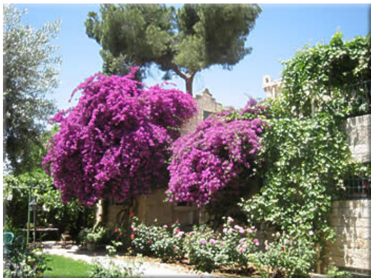
Kapellet på Svenska Teologiska Institutet höljt i sommarskrud!