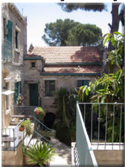
Svenska Teologiska Institutet med kapellet i bakgrunden.

internationell kurs på två månader att ordnas - precis som under de båda föregående höstterminerna.